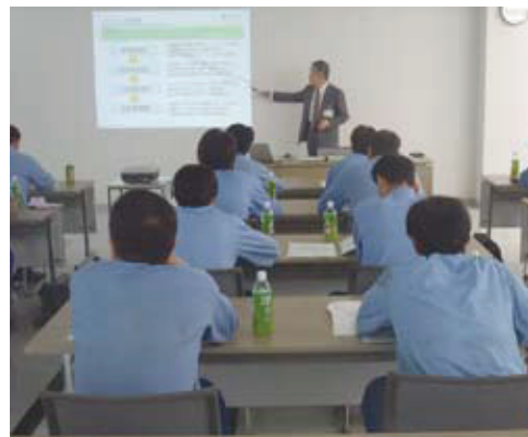
出張セミナー風景